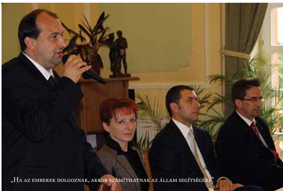
„HA AZ EMBEREK DOLGOZNAK, AKKOR SZÁMÍTHATNAK AZ ÁLLAM SEGÍTSÉGÉRE”