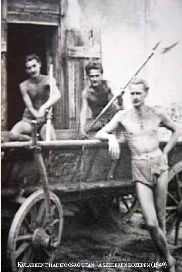
KULÁKKÉNT HADIFOGSÁG UTÁN – A SEKÉREK KÖZÉPÉN (1949)