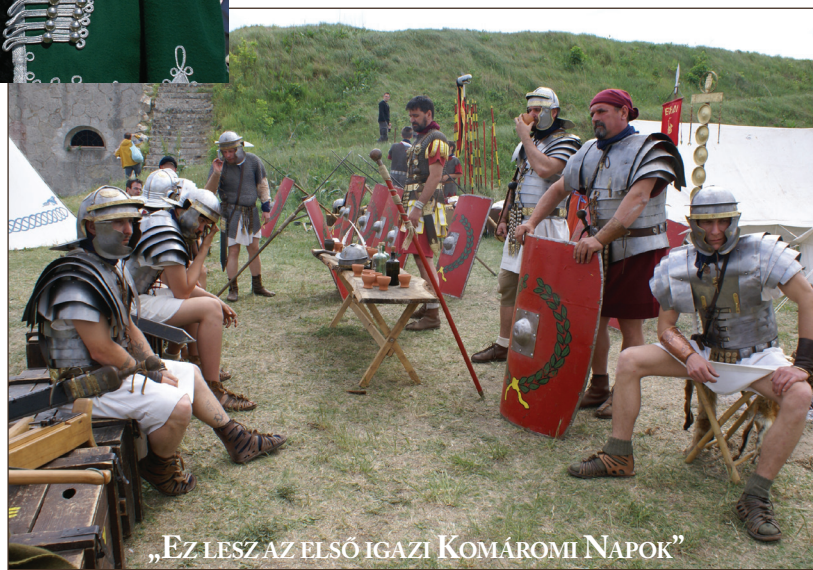
„EZ LESZ AZ ELSŐ IGAZI KOMÁROMI NAPOK”