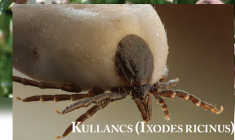
KULLANCS (IXODES RICINUS)

A tavasszal együtt nem csupán a természet éled újjá, de megjelennek a nem kívánt élősködők, a kullancsok is. A gyakori esők, a harmatos lombok, a kellemes meleg időjárás kedvez a parazita szaporodásának. A hiedelemmel ellentétben nem csupán az erdőt, mezőt járva szedhetünk össze egy-egy kullancsot, hanem a városok zöld területein is.