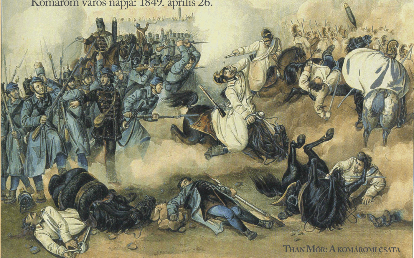
THAN MÓR: A KOMÁROMI CSATA

A két Komárom 1992 óta közös rendezvénye a Komáromi Napok, amely minden évben április 26-ával kezdődik. A dátum a szabadságharc egyik kiemelkedő hadászati fegyvertényének, komáromi vonatkozásban pedig mindenképpen a legjelentősebb és legdicőségesebb eseményének állít emléket, nevezetesen az 1849. április 26-i komáromi csatának. A tavaszi hadjárat végén vagyunk. Komáromot március 20-ától bombázza Balthasar Simunich osztrák altábornagy. A lakosság kimenekült a város északi részén lévő Cigánymezőre, minél távolabb az ágyúk hatóerejétől. A várban Török Ignác tábornokot, aki rangidős tisztként január 5-től töltötte be a várparancsnoki tisztséget, április 10-én felváltotta Lenkey János tábornok. Lenkeyt a várvédők parancsnokává nevezték ki, de ideiglenesen, Guyon Richárd tábornok megérkezéséig (április 20.), a várparancsnoki feladatokat is ellátta. A Görgey Artúr tábornok vezette magyar főszereg főoszlopa, az I. és III. hadtest, április 18-án átkelt a Garamon, elindult délnyugati irányba, és a