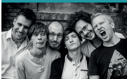
A nyári minifeszten fellépett többek közt az Esti Kornél is.

A Comorra Hagyományőrző Egyesület egy nyertes pályázat jóvoltából nyártól, az őszeleig tartó sokszínű ingyenes programsorozattal várta az érdeklődőket. A programoknak a Brigetio Taverna adott otthont. A helyszínen többek között kvízzjátékokkal, táncházakkal, különféle koncertekkel, tematikus kiállításokkal várták az érdeklődőket. Az aktuális járványügyi előírásoknak megfelelően az egyes alkalmakat regisztrációhoz és létszámkhoz kötötték a szervezők.