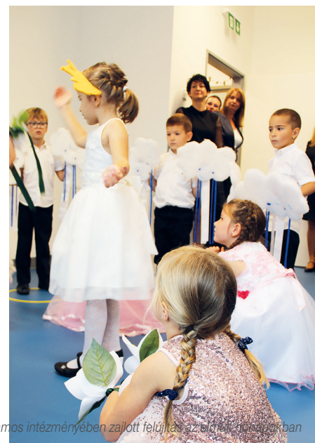
Városunk számos intézményében zajlott felújítás az elmúlt hónapokban

A Kultsár iskola korábban tetőfelújításon esett át, valamint új szigetelést is kapott, majd a régi aszfaltos kézilabdapálya helyett, korszerű, minden sportolási igényt kielégítő rekortán pályával gazdagodott.