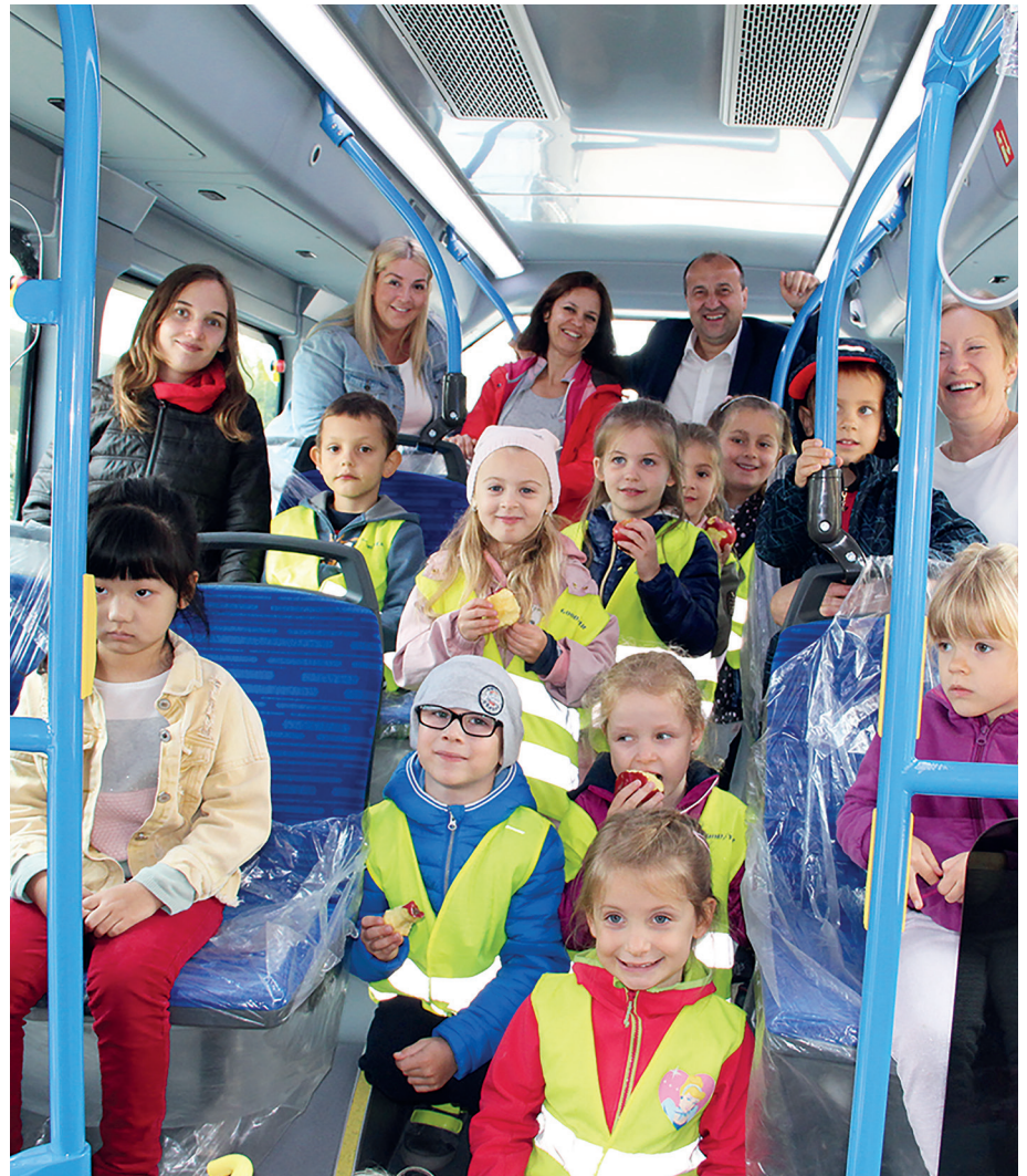
A komáromi BYD-ban készült elektromos buszt is kipróbálhatták.

Az időjárás is kedvezett az autómentes napon, melyet szeptember 20-án hétfőn rendeztek városunkban az új Nonprofit Szolgáltatóház udvarán és parkolójában.