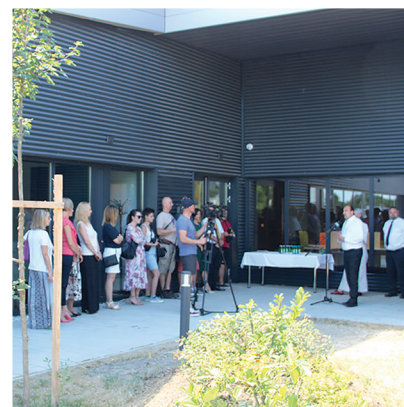
A nyáron átadott inkubátorház a hozzánk betelepülő vállalkozásoknak nyújt infrastrukturális háttérrel.