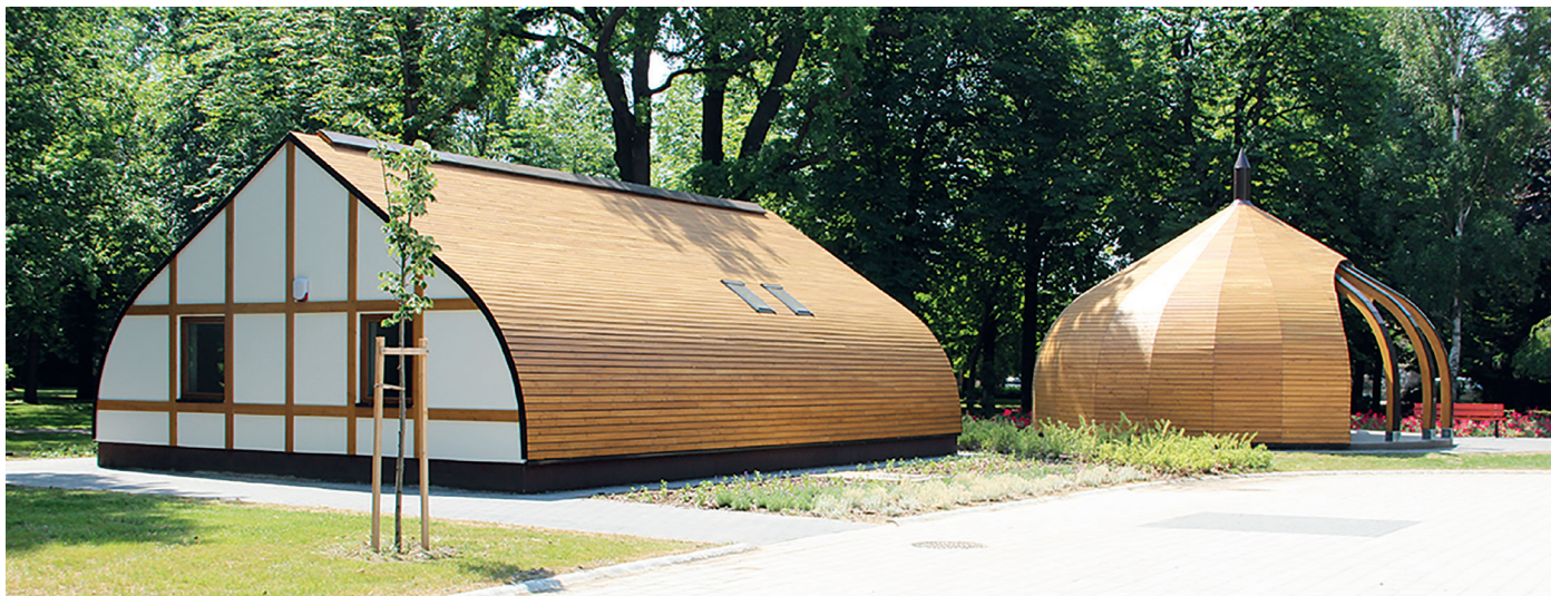
A Jókai liget zeneszín-pada a jövőben számos hangulatos eseménynek adhat majd otthont.