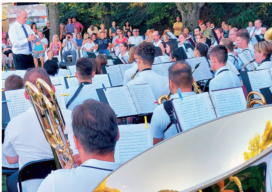
Több mint század fújták a Monostori erőd Dunai bástyájánál

Bár a járvány miatt az események zömét nem a szokásos módon lehetett megrendezni, azért az elmúlt hónapokban sem maradtunk programok nélkül. Összeszedtünk egy csokorra valót az elmúlt időszak kitüntetett eseményeiből.