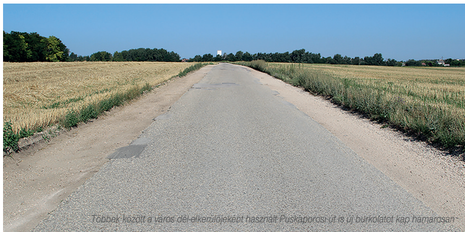
Többek között a város dél-keleti irányában használt Puskaporosi út is új burkolatot kap hamarosan

A komáromi út- és vasúti hálózatot kedvezően érintő kormányhatározatok jelentek meg még a nyár közepén a Magyar Közlönyben.