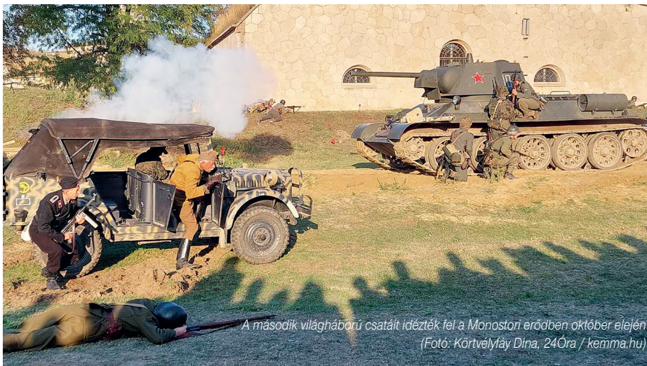
A második világháborús csatáit idézték fel a Monostori erődben október elején