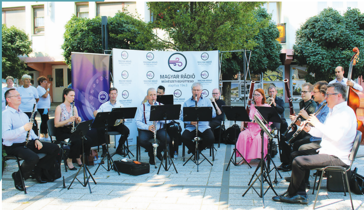
Egy hónapon át hétvégeként klasszikus muzsika szólt a Jókai téren