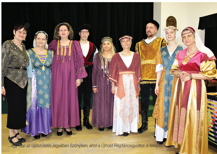
...egy nap az újjászületés jegyében Szőnyben, ahol a Újhold Régitáncegyüttes is fellépett.