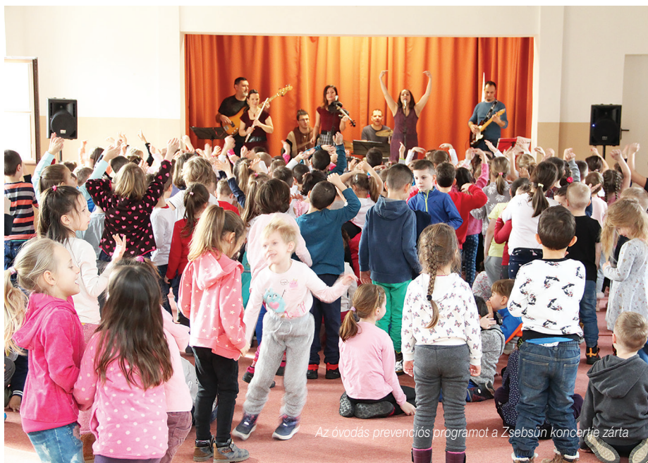
Az óvodás preventációs programot a Zsebsűn koncertje zárta