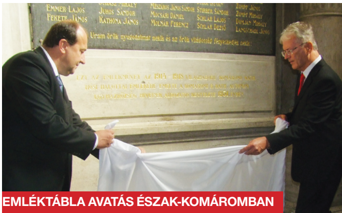
EMLÉKTÁBLA AVATÁS ÉSZAK-KOMÁROMBAN