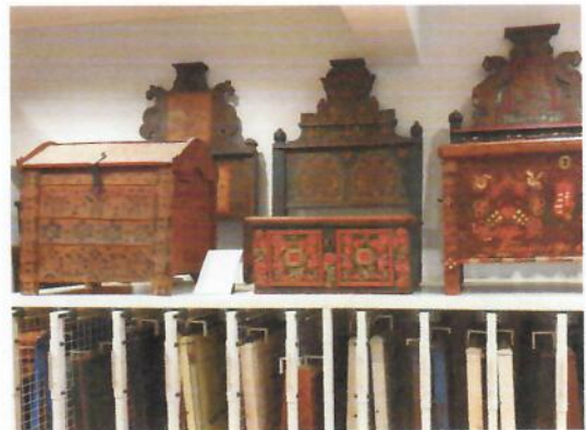
Baja, Türr István Múzeum