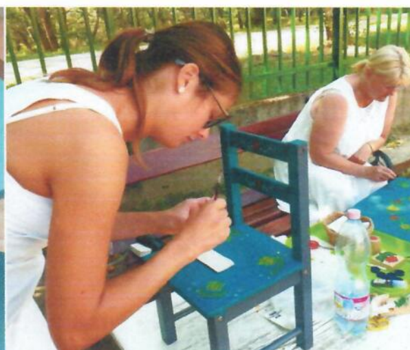
/Nyergesújfalu, Süttő, Lábatlan, Komárom, Tata, Tatabánya, Csolnok, Bajna, Esztergom, Budapest, Szombathely.../