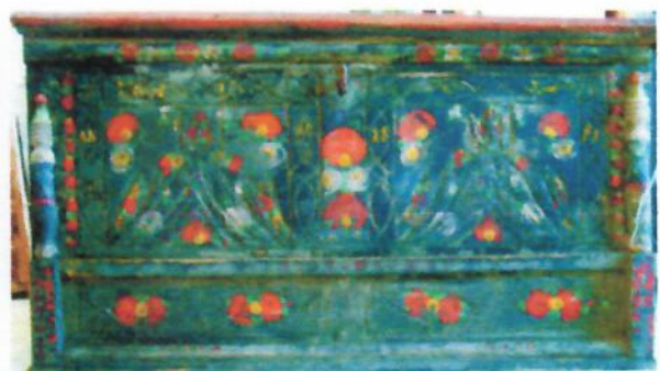
(Klapka György Múzeum, Komárom)