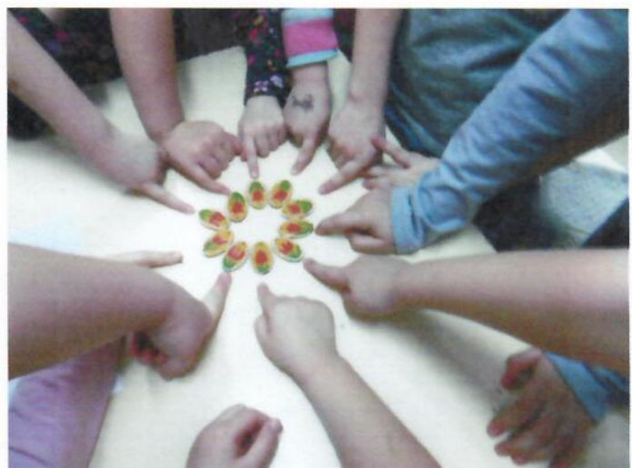
Óvodás és iskoláskorúak foglalkozásaiból /Nyergesújfalu, Süttő, Lábatlan, Komárom/