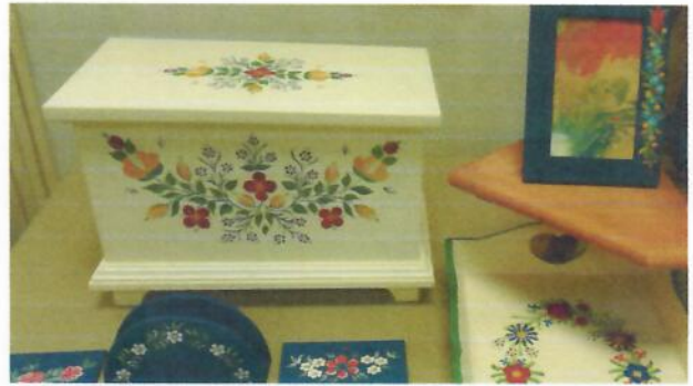
A Bútorfestő team munkában