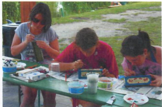
Nemzetközi alkotótábor /Komárom/