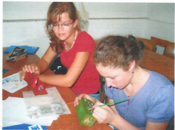
Nemzetközi Tehetséggondozó Alkotótábor /Tata/