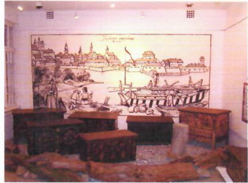
Komáromi láda kiállítás a Komáromi Klapka György Múzeumban 2005