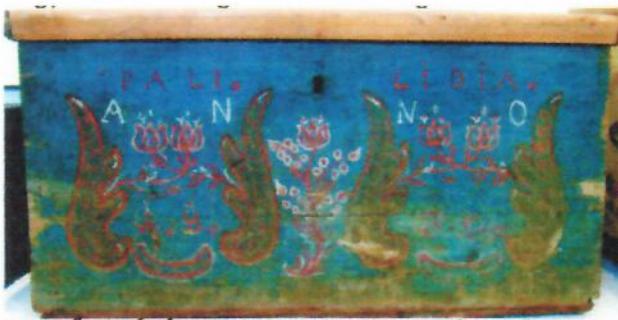
1837-BŐL VALÓ LÁDA (Kuny Domokos Megyei Múzeum, Tata)